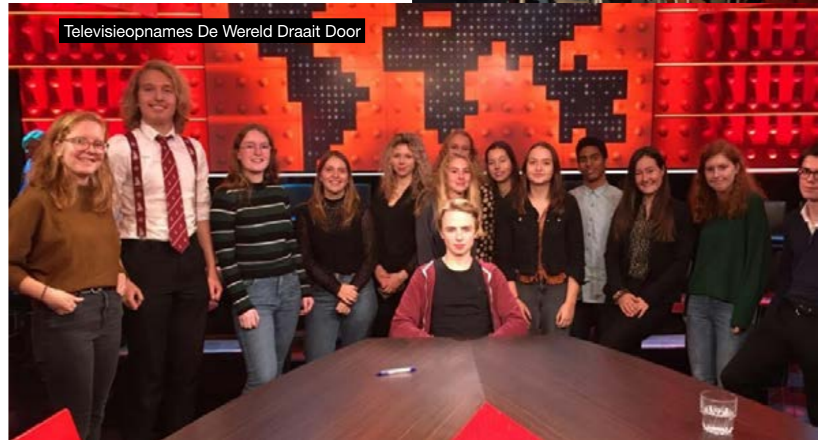
Televisieopnames De Wereld Draait Door

Het collegejaar is voorbij en de zomer staat voor de deur. Daarmee is ook het jaar van bestuur Karakter ten einde gekomen. Tijd voor nostalgie: we blikken terug op de activiteiten van afgelopen jaar.